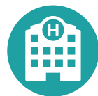
Part A 醫院保險