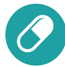
Part C Medicare Advantage