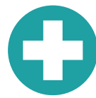
Part B 醫療保險